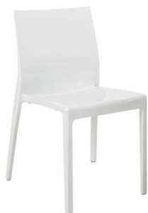
Bianco/White Ral 9016