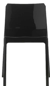
Nero/Black Ral 9005