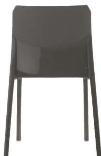
Grigio/Grey Ral 7022