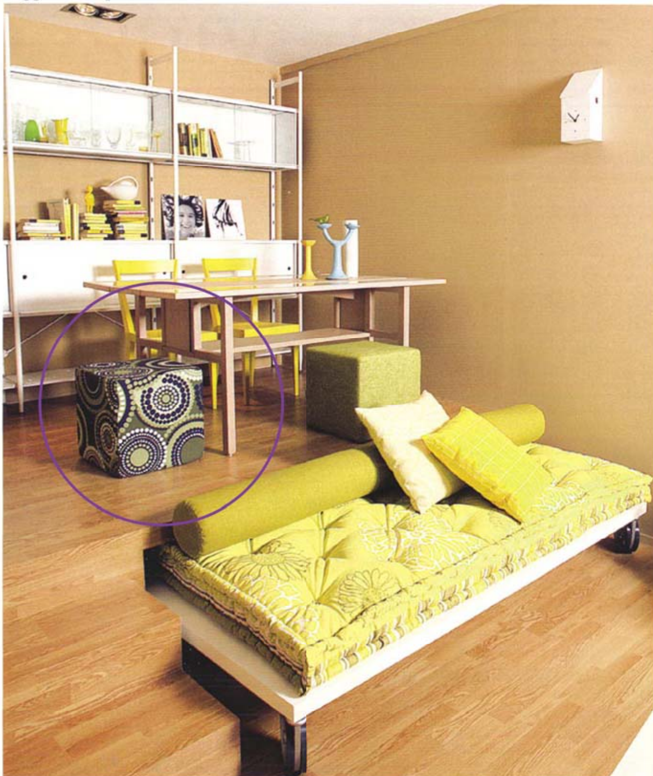
120 CASAFACILE giugno 2008